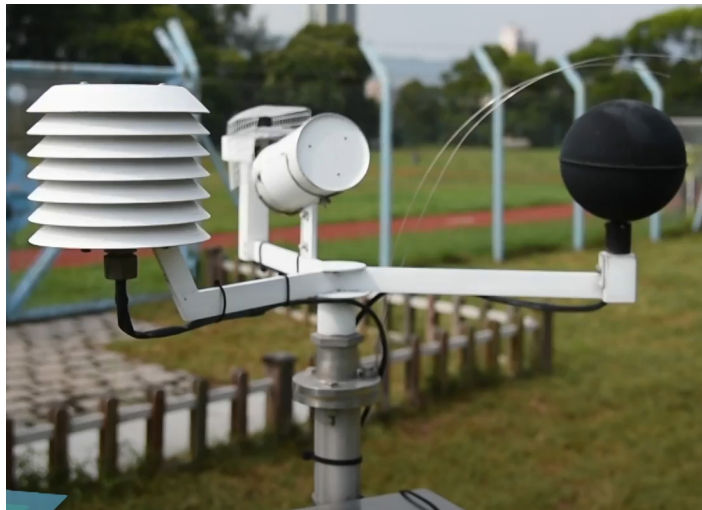
圖片3: 量度『香港暑熱指數』儀器 – 『暑熱壓力感測系統』(香港天文台)

本關注組建議，天文台在酷熱高風險及不適切居所集中地區例如深水埗，放置量度暑熱指數的儀器（請看圖片3）。更理想的是能放在室內，形成類似不適切居所環境。如果在該區量度的暑熱指數達到30或以上，經天文台的通知，民政事務處可在局部地區開放臨時避暑中心。