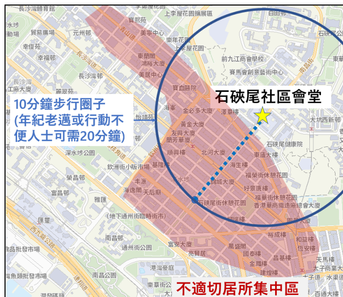
圖片1: 石硤尾社區會堂步行時間

部分夜間臨時避暑中心位於偏遠不便地點，而且遠離不適切居所集中區域。在極端天氣下，年紀老邁或行動不便人士較為難以前往。以深水埗區為例，由大南街經南昌街步行到石硤尾社區會堂平均需10分鐘，但長者及行動不便人士可需要20分鐘或以上。受最大影響的弱勢社群通常為了省錢，不會選擇乘車到達（請看圖片1）。